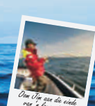
Om die see te verken, is 'n lang rit!