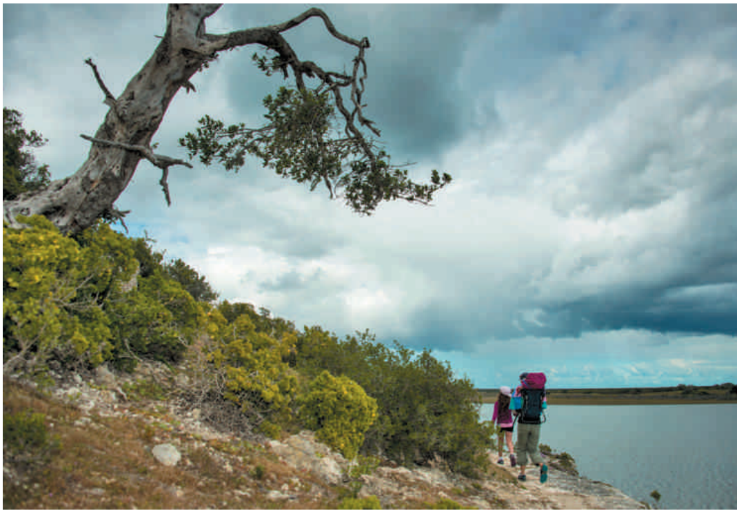
In die De Hoop-natuurreservaat kan jy kies tussen twee staproetes – een van 8 km en een van 3,5 km – wat teen die vlei langs loop.