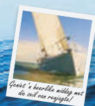
Geniet 'n heerlike middag met die wind aan jou rug!